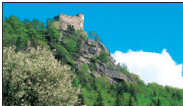
Zamek Chojnik w Polsce

ERN jest administratorem i zarządzającym Funduszu Małych Projektów Programu INTERREG IIIA. Kolejnym zadaniem ERN jest działalność w ramach Komitetów Sterujących Programu INTERREG IIIA. ERN poprzez swoich przedstawicieli opiniuje wykorzystywanie środków unijnych przeznaczonych dla obszarów przygranicznych. ERN świadczy na rzecz swoich członków oraz innych zainteresowanych z obszaru ERN usługi doarczycze w zakresie przygotowywania projektów tak, aby odnosiły sukces w konkurencji międzynarodowej.