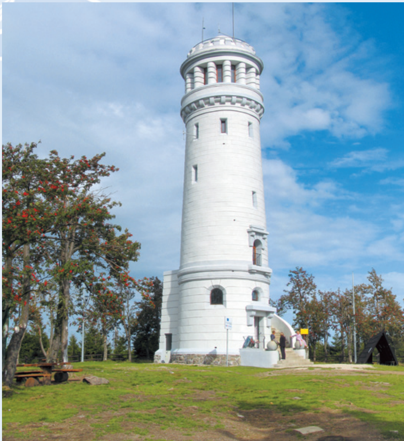
Wieża widokowa na najwyższym szczycie Gór Sowich – Wielka Sowa