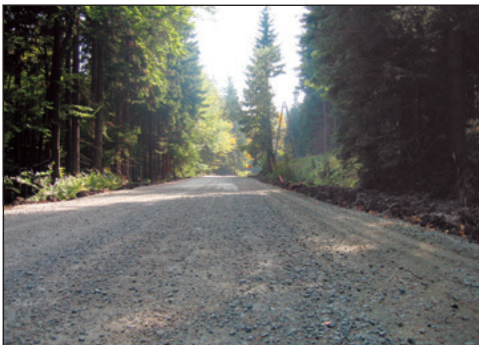
Trwająca modernizacja drogi na odcinku Zieleniec - Mostowice

Studium Zagospodarowania Przestrzennego Drogi Śródsudeckiej opracowało Wojewódzkie Biuro Urbanistyczne we Wrocławiu. W założeniu Droga Śródsudecka ma łączyć niemiecką Saksonię z czeskimi Jesionkami. Na wytyczonym 357 km polskim odcinku przewiduje warianty przebiegu przez Republikę Czeską. Wymaga to szczegółowych uzgodnień z czeskimi Part-