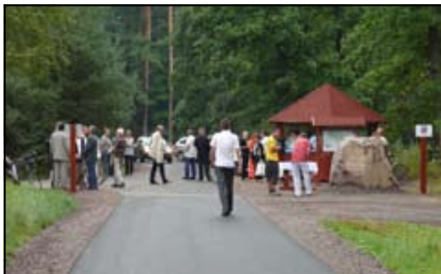
Otwarcie ścieżki rowerowej Borohrádek-Veliny, łączącej Kraj Pardubicki i Královéhradeckí.

Glacensis pod koniec minionego roku, jednak już wcześniej otworzyło swoje ościeże dla współpracy transgranicznej. Przede wszystkim uczniowie i nauczyciele Szkoły Podstawowej im. T.G.Masaryka od wielu lat współpracują z kilkoma szkołami zagranicznymi z różnych krajów Europy, między innymi również z polską szkołą z miejscowości Ciepłowodny. Obie szkoły zorganizowały już kilka wymiennych pobytów oraz wiele wspólnych konkursów. Przykład może stanowić konkurs piosenki Złoty Słownik.