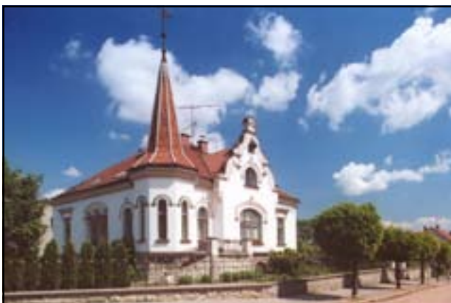
Prywatna willa nr 37.

Barokowy kościół zbudowano na zlecenie Ferdynanda Ludwika z rodu Libštejnских z Kolowrat. Przy kościele stoi drewniana dzwonnica. Elementem murów obwodowych sąsiedniego cmentarza jest ciekawy budynek neogotyckiego grobowca zbudowany z piaskowca.