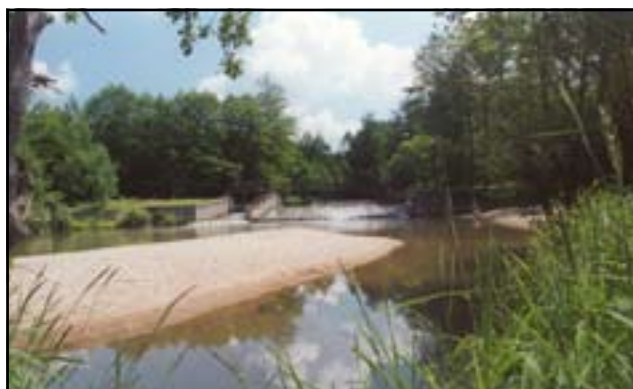
Spiętrzenie na Cichej Orlicy.

Okolice Borohrádku są wręcz idealne dla relaksu i rekreacyjnych