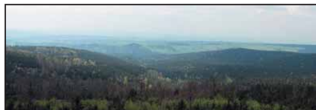
Widok na Kotlinę Łabską