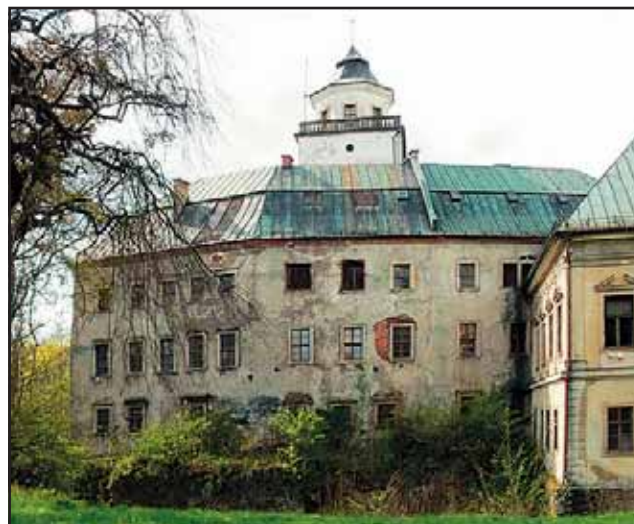
Międzyzlesie (wieża pochodzi z grodu)