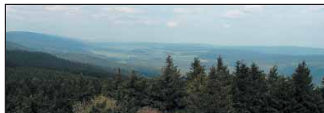
Dolina Dzikiej Orlicy rozdzielająca Góry Orlickie (po lewej) i Góry Bystrzyckie w Polsce (po prawej)