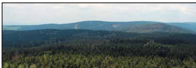
Wzgórze Zakletý z ośrodkiem narciarskim