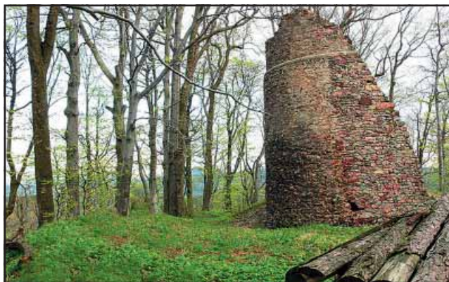
Stożek pozostałość wieży (Zamek Leviński)

W związku z walkami prowadzonymi przez czeskiego księcia Brzetysława II (1092 - 1100) z polskim księciem Władysławem Hermanem wspomniana jest „prowincja Kłodzka”, co wskazuje na to, że Kłodzko było już pewną jednostką administracyjną – kasztelaniją. Czeski książę Brzetysław II po zawładnięciu większej części Śląska zawarł z Władysławem Hermanem pokój. Na podstawie zawartego rozejmu czeski książę prawdopodobnie przekazał zdobyte tereny Śląska (Kosmas jednak nie mówi bezpośrednio o Śląsku, wspomina jednak grody - wyraz ten oznacza jednostki administracyjne, które sąsiadują z Ziemią Kłodzką), będące pod panowaniem Czech w zarządzanie polskiemu księciu Bolesławowi, późniejszemu księciu Bolesławowi III Krzywoustemu. Wieloznaczność łacińskiego czasownika pertinere (graniczyć z, należeć do) jednak pozwala informację tę interpretować jako zdobycie Ziemi Kłodzkiej (grodów należących do Kłodzka) przez księcia Bolesława i w części polskiej historiografii stanowiło to dowód na to, że Kłodzko należało w tym czasie do Polski, a nie do Czech. Ogólna logika wydarzeń jednak wskazuje na przekazanie polskiemu księciu Śląska, a nie Ziemi Kłodzkiej będącej pod czeskim panowaniem.