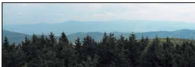
Widok na Masyw Śnieżnika i Kotlinę Kłodzką